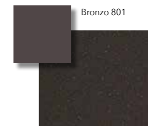
Bronzo VS 801