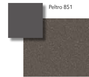
Pelto VS 851

Alcuni esempi • Quelques exemples • Some examples • Einige Beispiele