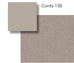
Corda VS 130