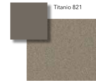
Titanio VS 821