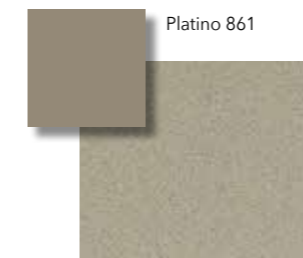
Platino VS 861