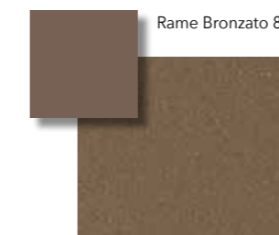
Rame Bronzato SG 801